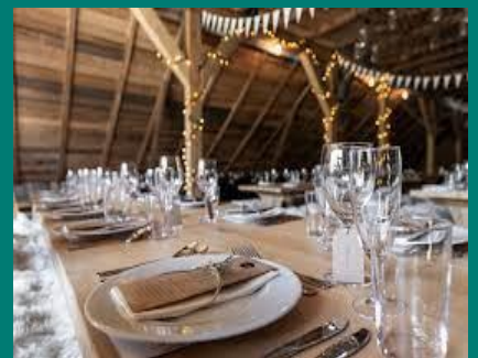
Felles middag på Låven

Valgfri overnatting i Hemsedal. Valgfri middag på Fausko Gjestegard